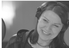
Inga Rumpf, Musikerin, Soulsängerin und Komponistin