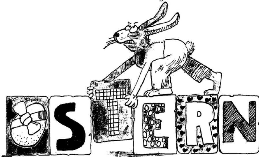
Rätsellösung S. 11

Im Wort „Ostern“ sind viele andere Worte versteckt. Schüttle alle Buchstaben durcheinander und suche so viele Worte wie möglich!